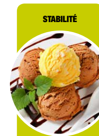
Gâteaux, crèmes glacées, ...