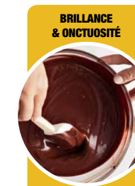
Ganaches, glaçages, ...