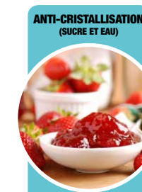
Confitures, crèmes glacées, sorbets, décor en sucre, ...